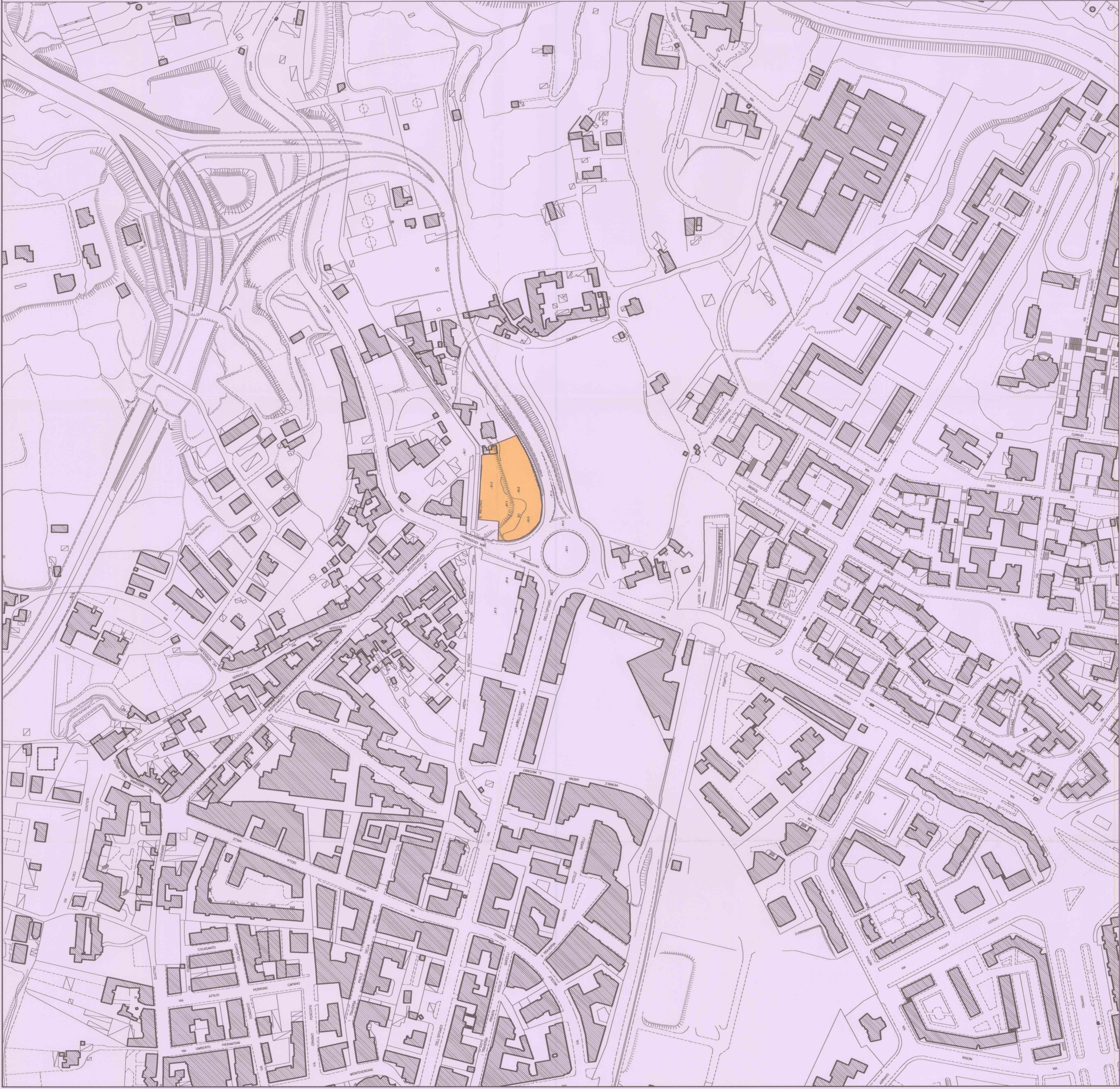
PLANIMETRIA SCALA 1:1000