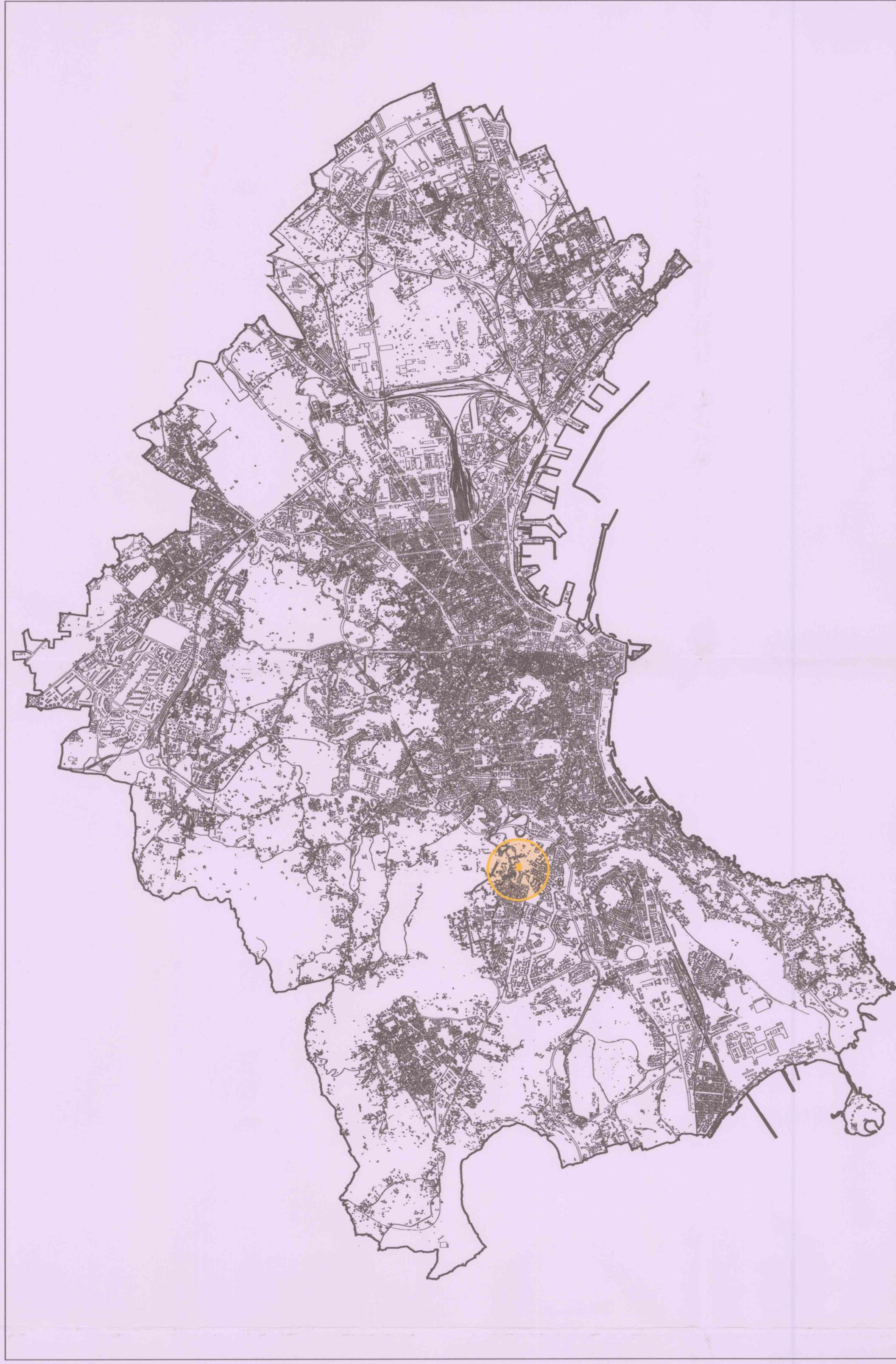
COMUNE DI NAPOLI